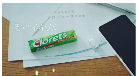
「そのイキだ。」とクロレッツは見守っている