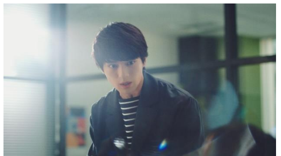
熱くアイデアを語り始める