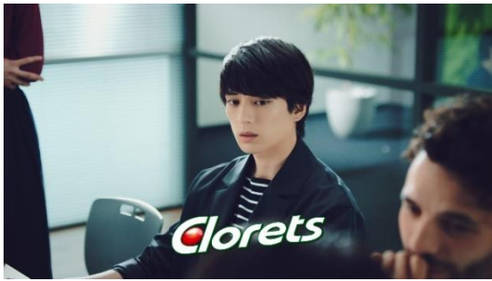
白熱した議論が続くミーティング中

・TVCM「ディスカッション」篇 ※本シートからの画像掲出はお断りさせていただきます。