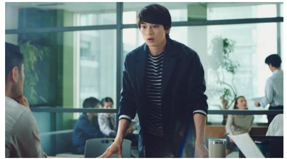
意を決したように立ち上がり