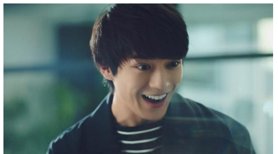
確固たる手ごたえに、笑顔もこぼれるように