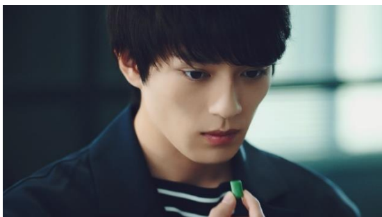
クロレッツを一粒お口の中へ