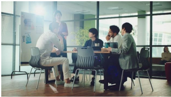
なかなか自分の意見を言い出せず…