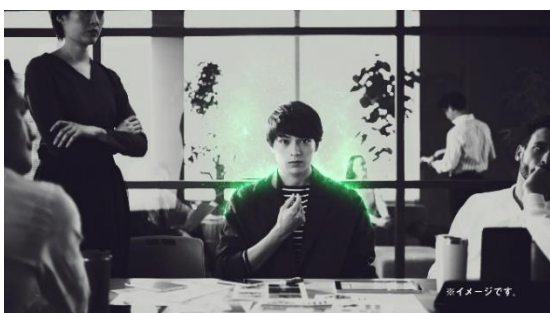
リフレッシュすると