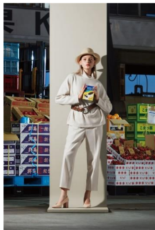
大人クリーミーワントーンコーデ