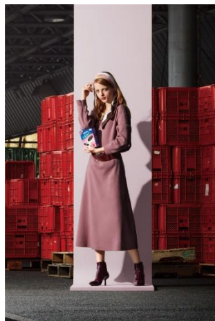
甘すぎない大人ピンクコーデ