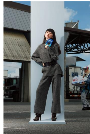
シックな大人モノクロコーデ

■動画広告: コラボコーデに身を包んだファッションモデルが青果市場でダンス?! 自由すぎる告知ムービー!